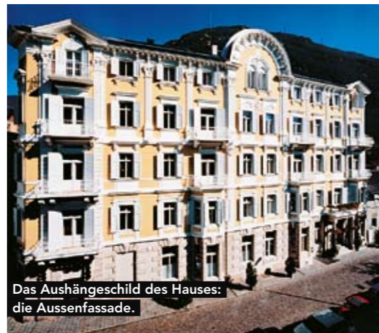
Das Aushängeschild des Hauses: die Aussenfassade.