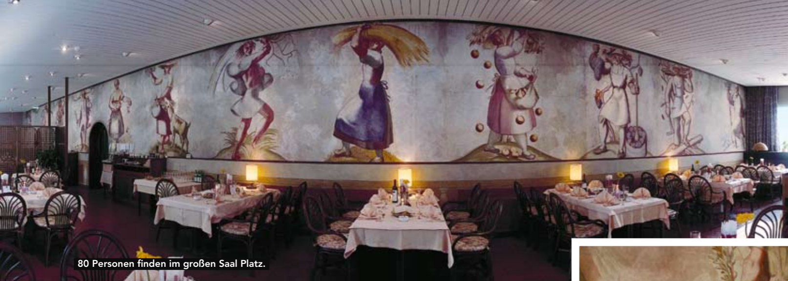
80 Personen finden im großen Saal Platz.

hier der berühmte Freskenzyklus der 12 Monate vom Bozner Künstler Rudolf Stolz. Wer hingegen unter den jahrhundertealten Kastanienbäumen im Freien seine Mahlzeit zu sich nehmen will, kann das von Ende April bis Ende September an jedem Tag der Woche tun, außer sonntags, da ist Ruhetag.