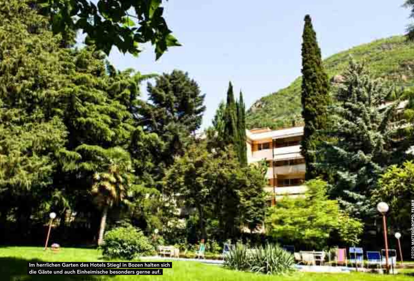
Im herrlichen Garten des Hotels Stiegl in Bozen halten sich die Gäste und auch Einheimische besonders gerne auf.