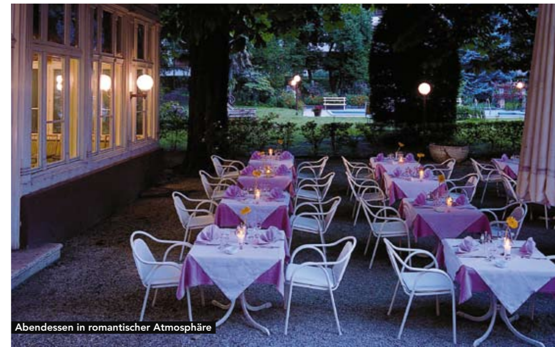
Abendessen in romantischer Atmosphäre