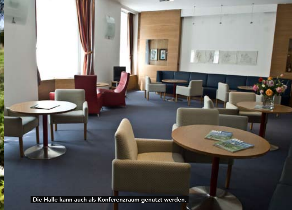
Die Halle kann auch als Konferenzraum genutzt werden.