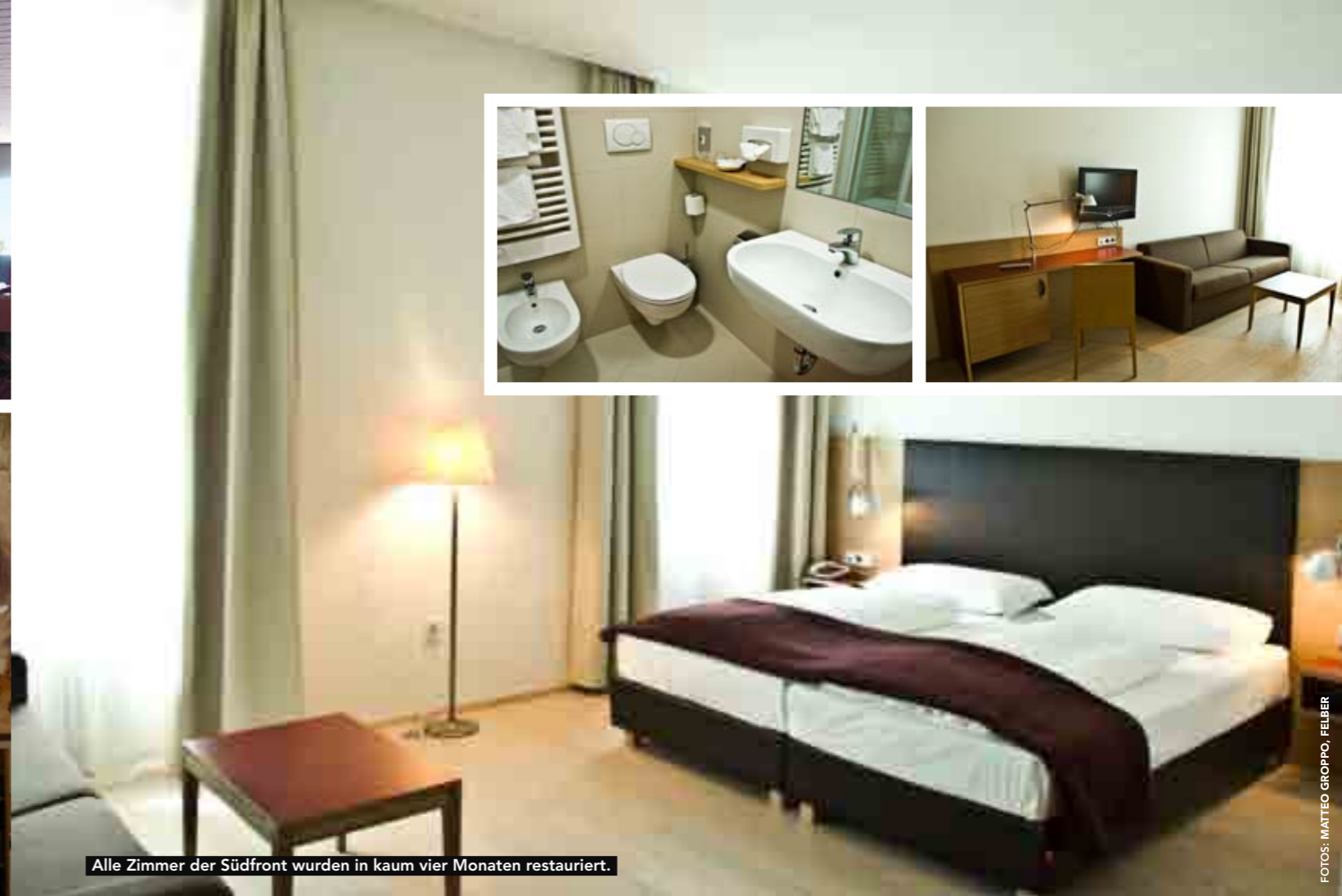
Alle Zimmer der Südfront wurden in kaum vier Monaten restauriert.