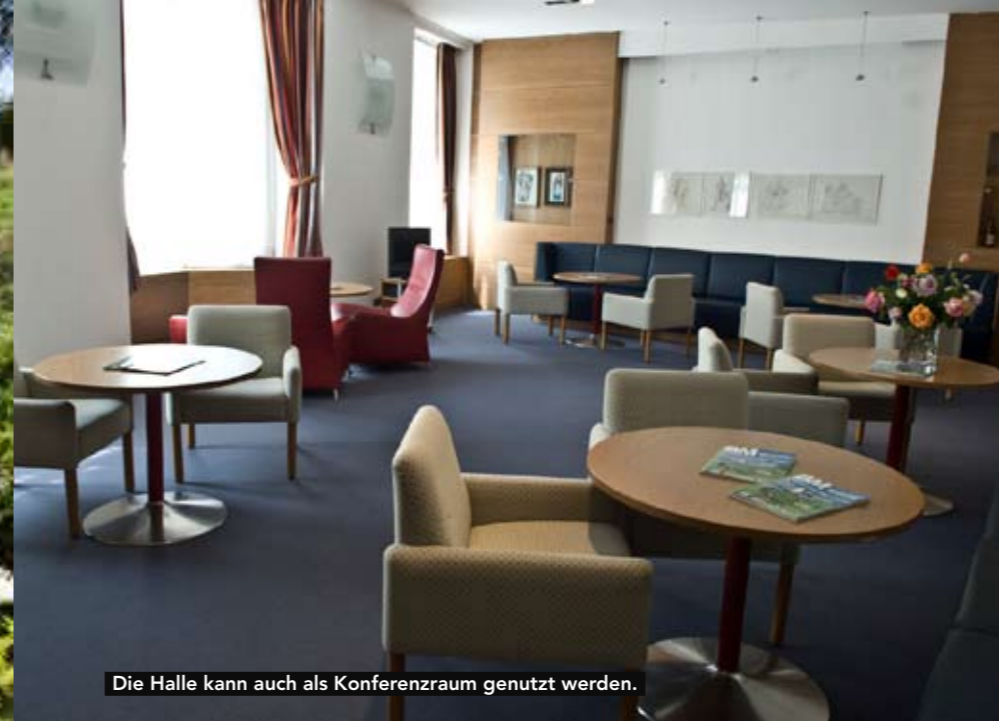
Die Halle kann auch als Konferenzraum genutzt werden.