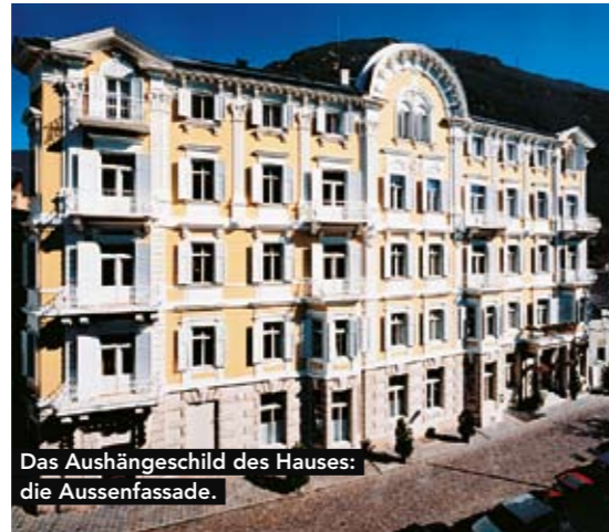
Das Aushängeschild des Hauses: die Aussenfassade.